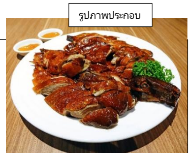
รูปภาพประกอบ

16.20 น. เดินทางกลับกรุงเทพฯ โดยสปริงแอร์ เที่ยวบินที่ 9C7485