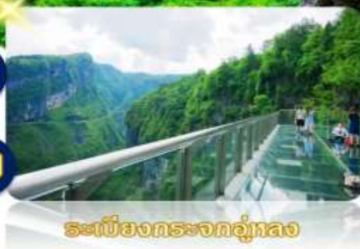
ระเบียงกระจกอุ้หลง