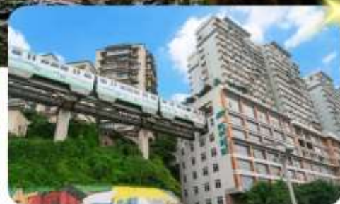
รถไฟทะเลลึก