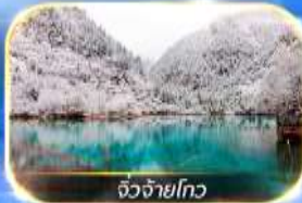
จิว่จ้ายโกว