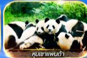
หุบเขาแพนต้า

สัมผัสความงามของธรรมชาติ 2 อุทยาน อุทยานจิว่จ้ายโกวและอุทยานน้ำแข็งต้ากู่ นั่งรถไฟความเร็วสูง ชมความน่ารักของน้องหมีที่หุบเขาแพนต้า ซอปปิ้งที่ไท่กู่หลี่ ดูแพนด้ายักษ์ป็นตัก