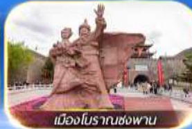
เมืองโบราณซ่งพาน