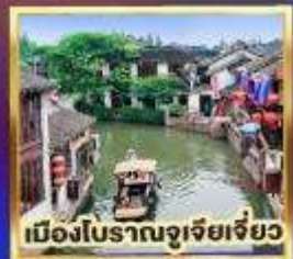
เมืองโบราณจูเจียเจียว