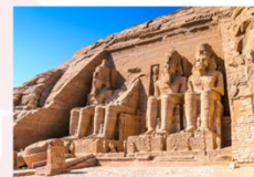
มหาวิหารอาบูซิมเบล

** พักที่ JAZ Crown Jewel Nile Cruise 4* หรือเทียบเท่า **