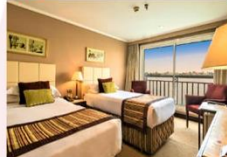
เรือสำราญแม่น้ำไนล์

** พักที่ JAZ Crown Jewel Nile Cruise 4* หรือเทียบเท่า **