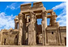
วิหารคอมมอโบ