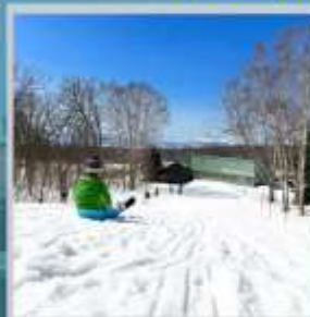
"NISEKO SKI RESORT"