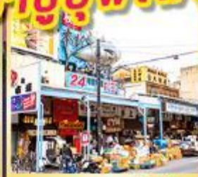
ตลาดปลาชิทิจิ