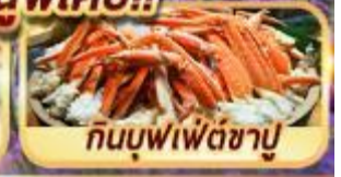
กินบุฟเฟ่ต์ชาบู