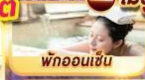
พักผ่อนเซ็น