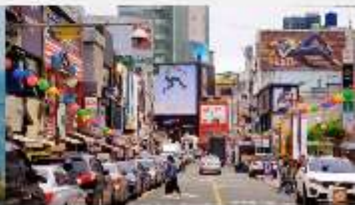
nampodong shopping street

*ทางบริษัทฯ ขอสงวนสิทธิ์ในการสลับโปรแกรมทัวร์ตามความเหมาะสมขึ้นอยู่กับสถานการณ์หน้างาน โดยคำนึงถึงผลประโยชน์ของลูกค้าเป็นสำคัญ