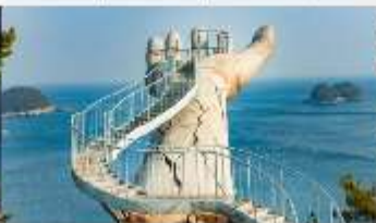
Yeosu Art land